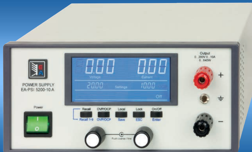
EA-PSI 5200-10 A